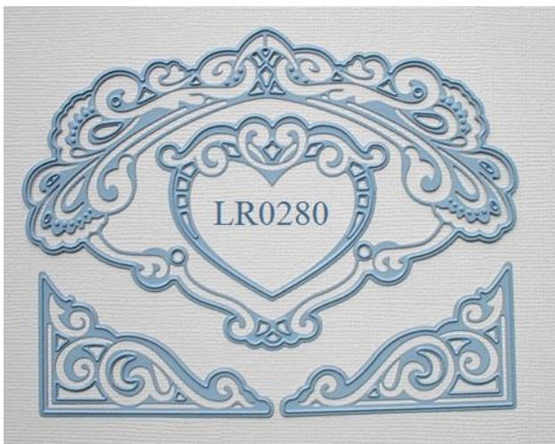
Creatables: LR0280 Petra's heart