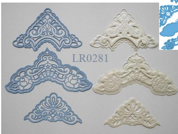
Creatables: LR0281 Petra's corners