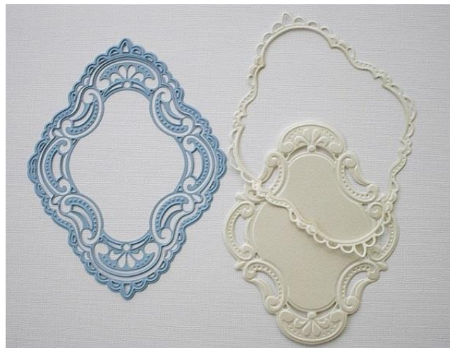
Foto 2: Stans met 2 mallen tegelijk door de machine. Voorkom dat de mallen gaan schuiven. Zet ze daarom op het papier vast met verwijderbare tape. Het midden van het grootste ovaal is nu open.