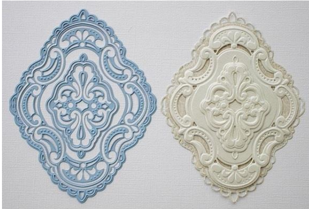
Creatables: LR0279 Petra's ornaments.